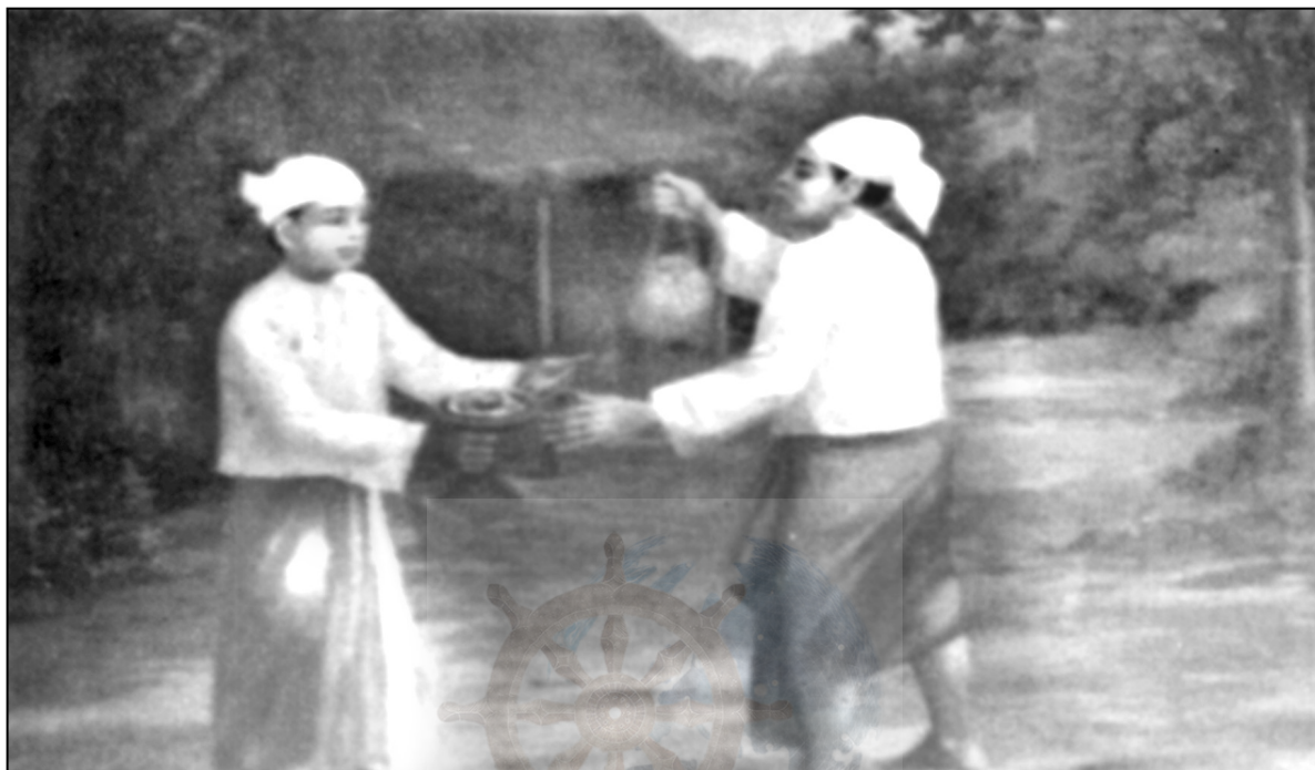
(१०) सपना देखेको दृश्य- अमूल्य भाँडो दिई मुल्यहीन सिंके अथवा गुन्द्रक साटेर लिएको दृश्य ।