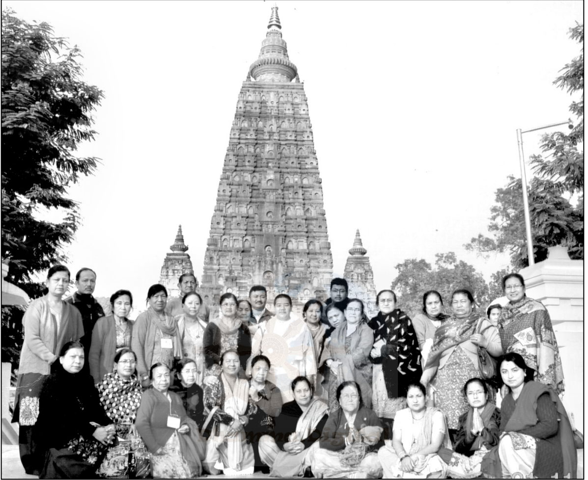
तीर्थयात्रा समूह, बौद्ध गयामा