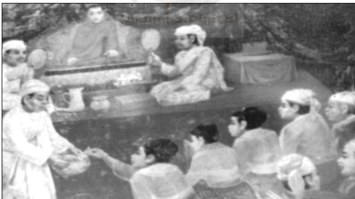
अर्थ- कलियुगमा मानिसहरू बुद्धको अमूल्य उपदेश साटी मुल्यहीन धनको लोभ गर्नेछन् ।