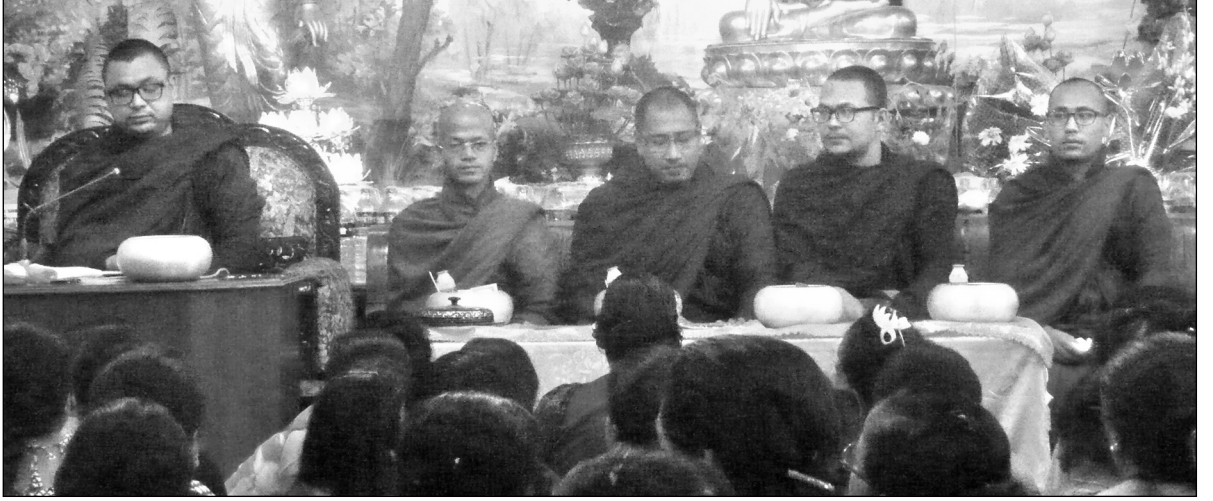
भिक्षु संघवाट अभिधर्मपाठ हुँदै

धर्मकीर्ति संरक्षण कोषले तत्कालिन प्रधानमन्त्री के.पी. शर्मा ओली र संस्कृति मन्त्री आनन्द प्रसाद पोखरेललाई सम्मान पत्र प्रदान गर्ने कार्यक्रम आयोजना गरिएको थियो । प्रधानमन्त्री ओलीको अध्यक्षतामा गठित २५६० औं बुद्ध जयन्ती र बौद्ध सम्मेलन सफलतापूर्वक