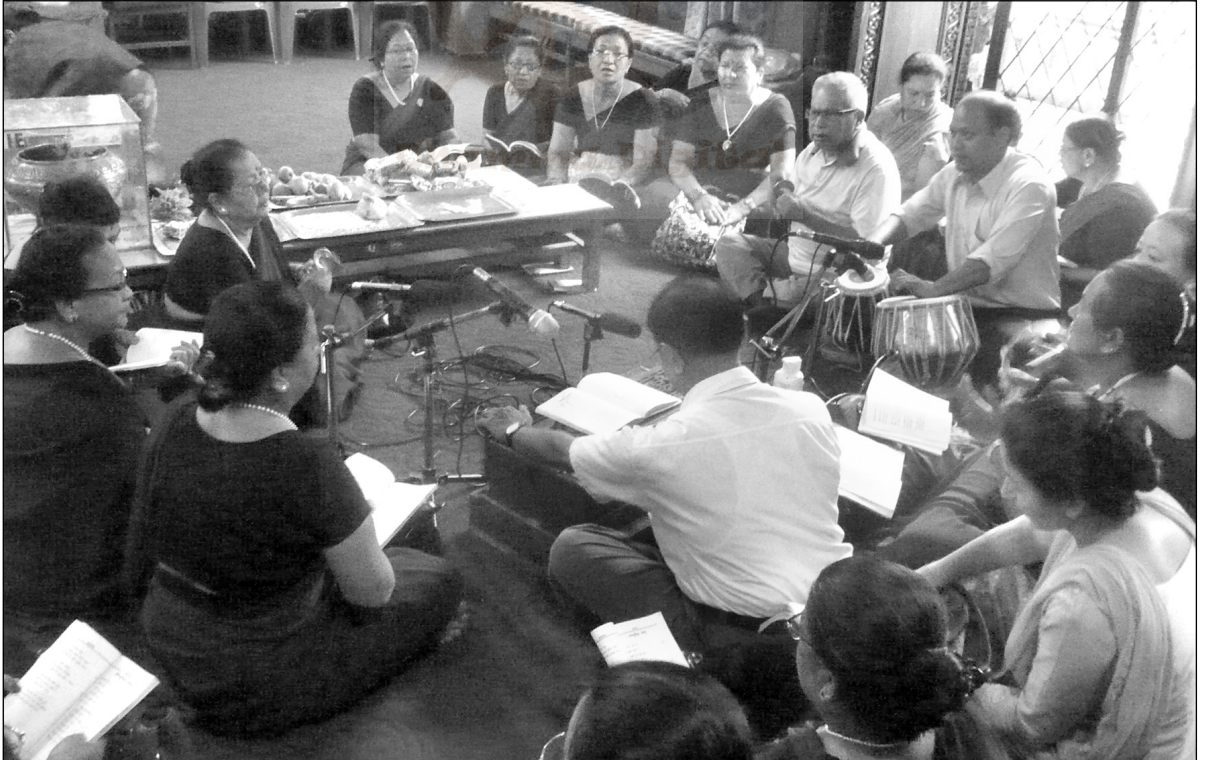
धर्मकीर्ति ज्ञानमाला भजनले भजन प्रस्तुत गर्दै