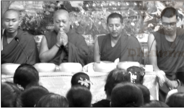
महायानी गुरुहरूबाट शान्तिपाठ हुँदै