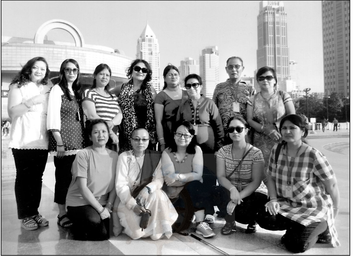
चीनको Shanghai मा यात्री समूह