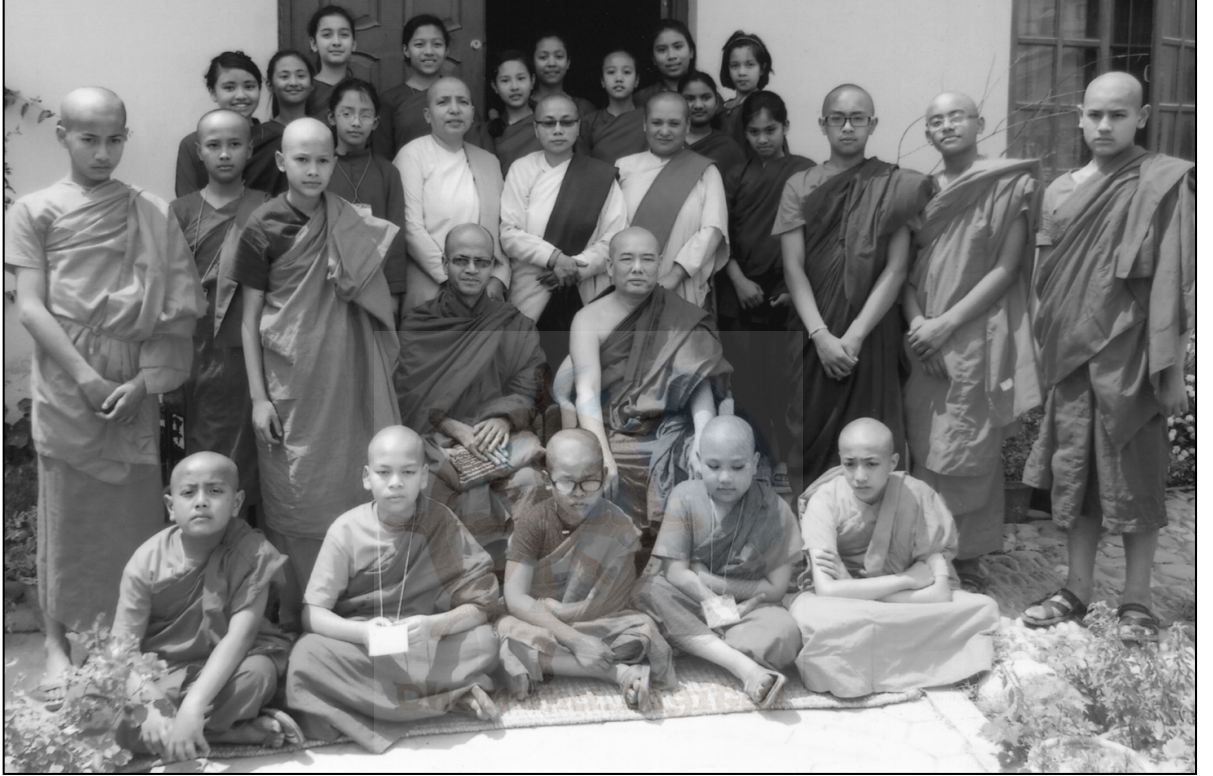
कार्यक्रममा सहभागी श्रामणेर ऋषिणीहरूका साथ आयोजक संयोजक एवं प्रशिक्षकहरू