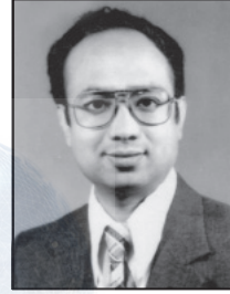
दि. देवरत्न कंसाकार