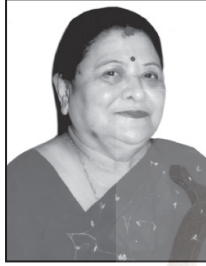
दि. सानु बहिनी राजकर्णिकार