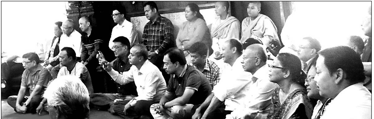
योगाम्बर गुठीका कार्यकर्ताहरू महापरित्राण पाठ श्रवण गर्नुहुँदै