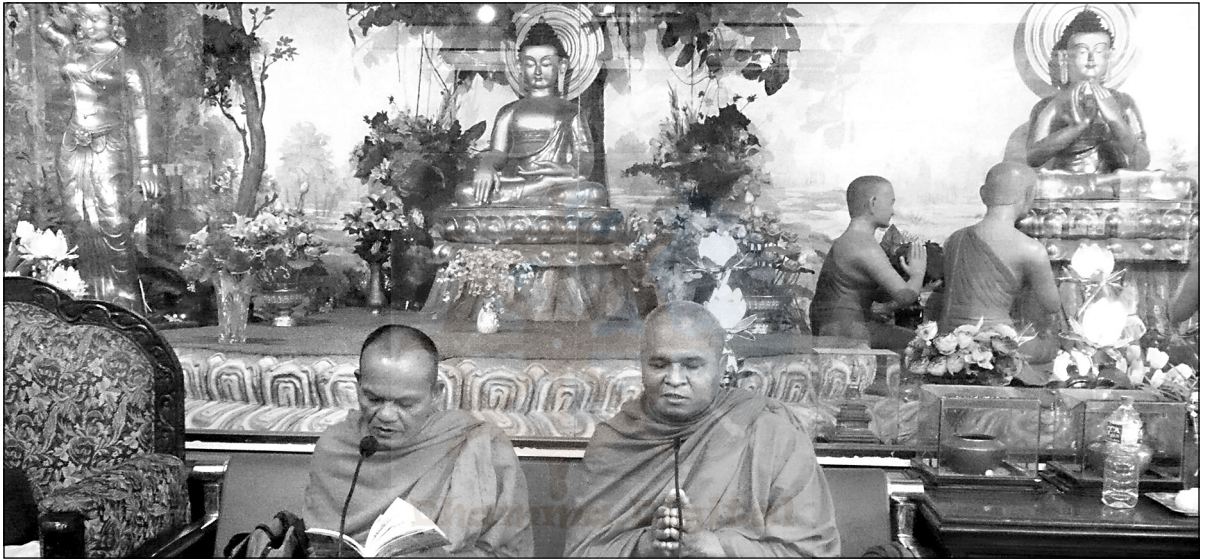
धम्मचक्कप्पवत्तन सूत्र पाठ गर्नुहुँदै थाई भन्तेहरू