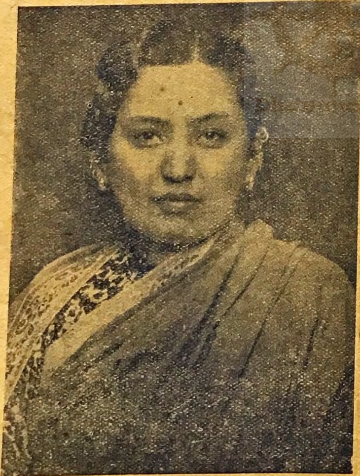
स्वर्गाय केशावती मय्यु