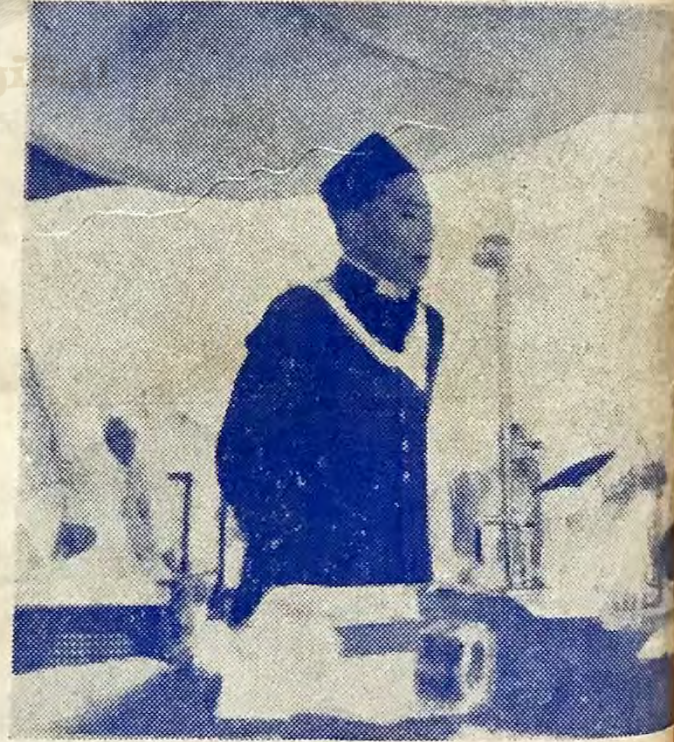
उद्योग व वाणिज्य मंत्री श्री गणेशमानसिजुं भाषण बिया च्वंगु ।