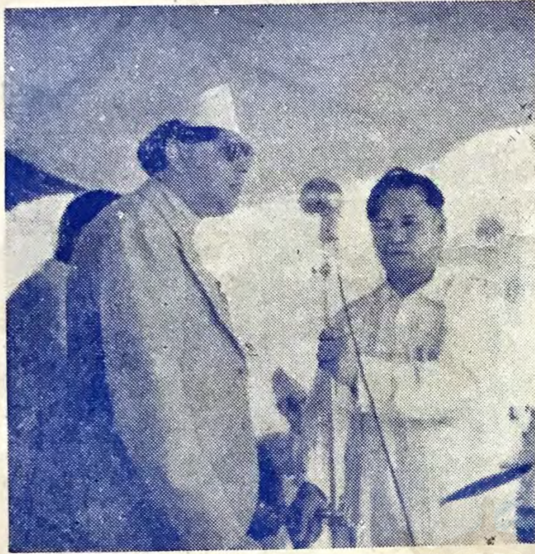
श्री ५ त्रिभुवन वीर विक्रम शाहदेवं भाषण बिया च्वंगु ।