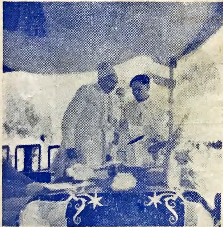
शिक्षामंत्री श्री नृपजंगजुं भाषण बिया च्वंगु ।